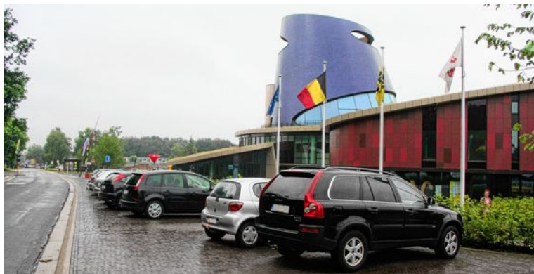
De nieuwe wijk komt achter het Nac te liggen.